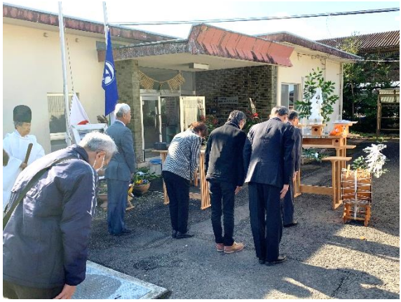
安全祈願祭の様子