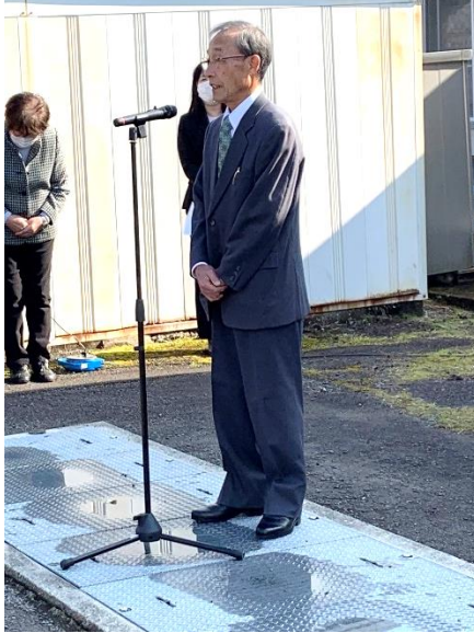
大辻理事長 新年の挨拶