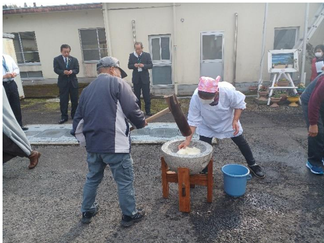
最後に毎年恒例の餅つき！