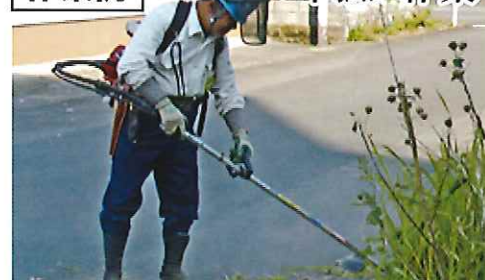
作業例 草払い作業